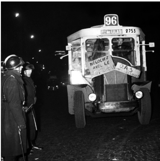
Manifestation anti-OAS: Bus 96, 19 décembre 1961.

journées d'études • mardi 11 & mercredi 12 février 2014 Campus de l'université Paris Ouest Nanterre • salle de réunion de la Bibliothèque de Documentation Internationale Contemporaine